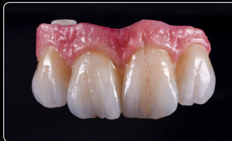
Czerwona i biała estetyka