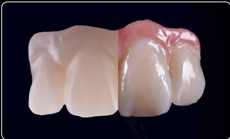
Maksymalna estetyka przy użyciu mikrowarstwy