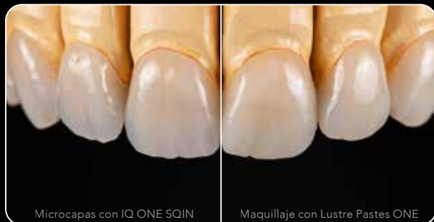
Microcapas con IQ ONE SQIN