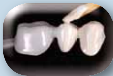
Aplique una capa de Initial IQ Light Reflective Liner de GC para enmascarar la estructura de zirconio.