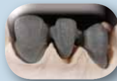
Estructuras de metal coladas o con el sistema CAD / CAM.