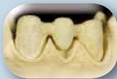
Aplique una fina capa fluida (wash) de Frame Modifiers.