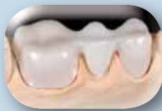
Estructura de dióxido de zirconio.