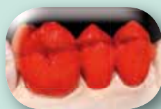
Modelado de toda la pieza con una sola masa.