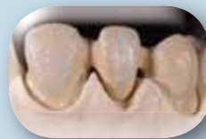
Aplique una fina capa de Opaquer fluida (wash) con Initial MC Paste Opaque de GC con la ayuda de un pincel. Antes de la cocción se aplican Fluo crystals en la superficie del Opaquer.