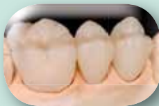
Tulos yhden polton jälkeen.