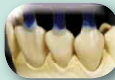
Opaakkipolttojen jälkeen tehdään muotovahaus tehdasvalmisteisten vaha-aihioiden avulla. 0,8 mm:n kerrospaksuudella saadaan esteettisesti hyväksyttävä lopputulos.