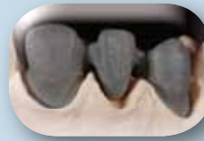
Valamalla tai CAD/CAM-menetelmällä valmistetut metallirungot.