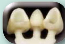
Tulos prässäyksen jälkeen.