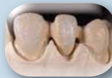
Levitä ohut GC Initial MC -pastaopaakkikerros. Ennen polttoa opaakkipinnalle vietään Fluo Chrystal kiteitä.