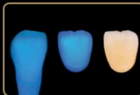
Lijevi zub: Initial LiSi

Posebno izrađena i prilagođena dinamici svjetla litij-disilikatnih osnova