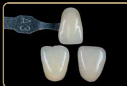
brez izgube svetlosti

Visoka stabilnost pri pečenju keramike, tudi po večih ciklih