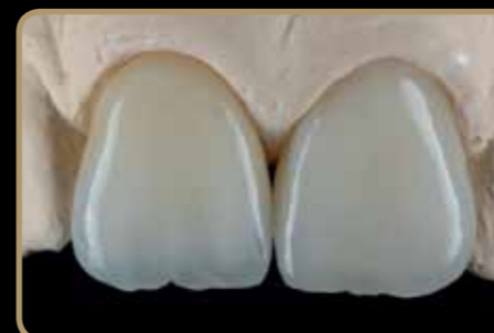
z obstojnostjo internih karakteristik

Posebno oblikovan in prilagojen na svetlobno dinamiko litijum disilikatnih ogrodij