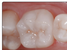
Initial LiSi Block overlejš na zubu 36