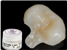
Initial LiSi Block