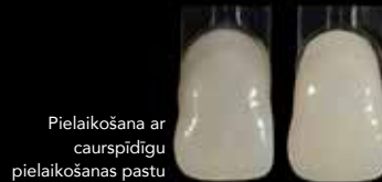
Pielaikošana ar caurspīdīgu pielaikošanas pastu

Izmantojiet Initial LiSi Block Bleach krāsu, ja nepieciešams izteikts balināšanas efekts vai arī kā bāzi vēlākai mikroslāņošanai ar Initial IQ ONE SQIN sistēmu.