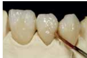
Нанесување на основните бои