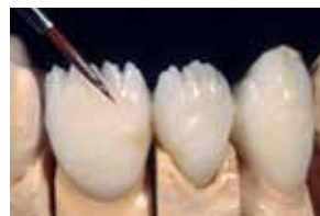
Нанесување на Lustre Pastes