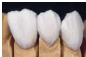
Mase ceramice opalescente/incizale