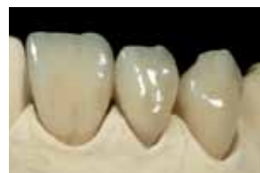
Končni izdelek z barvo in sijajem

Z Lustre Pasto NF lahko enostavno spreminjate vaše tradicionalne keramične prevleke in mostovne konstrukcije. Spreminjanje svetlosti, value in barve še nikoli ni bilo tako preprosto!