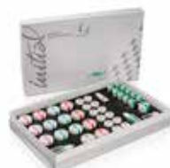
Initial IQ ONE SQIN