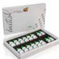
Initial Zirconia Coloring Liquids