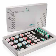
Initial IQ ONE SQIN

GC EUROPE N.V. • Researchpark • Haasrode-Leuven 1240 • Interleuvenlaan 33, 3001 Leuven • Belgium Tel. +32.16.74.10.00 • Fax. +32.16.40.48.32 • info.gce@gc.dental • https://www.gc.dental/europe