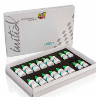
Initial Zirconia Coloring Liquids