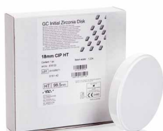
Initial Zirconia Disk