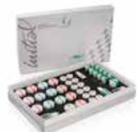
Initial IQ ONE SQIN

GC EUROPE N.V. • Researchpark • Haasrode-Leuven 1240 • Interleuvenlaan 33, 3001 Leuven • Belgium Tel. +32.16.74.10.00 • Fax. +32.16.40.48.32 • info.gce@gc.dental • https://www.gc.dental/europe