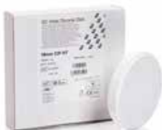
Initial Zirconia Disk