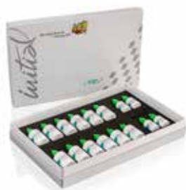
Initial Zirconia Coloring Liquid