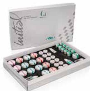
Initial IQ ONE SQIN