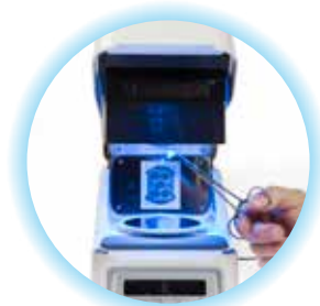
Modo por pasos

GC Labolight DUO no solo es capaz de realizar la mayoría de sus tareas, sino que también ofrece un buen aspecto. El premiado diseño elegante, contemporáneo y con superficies suaves, permite una fácil limpieza y reduce el espacio que ocupa en su laboratorio. Este diseño proporciona una gran facilidad de uso: la interfaz/panel de comunicación es muy sencilla e intuitiva y sus componentes internos son fácilmente accesibles gracias a su amplia apertura.