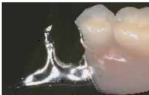
3. Nanesite akrilat (ali sloj opakra).