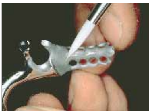
2. Nanesite GC Metalprimer II na čisto kovinsko površino s čopičem. Pustite da se posuši (nekaj sekund).