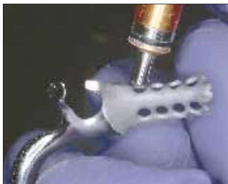
1. Peskanje kovinske površine.