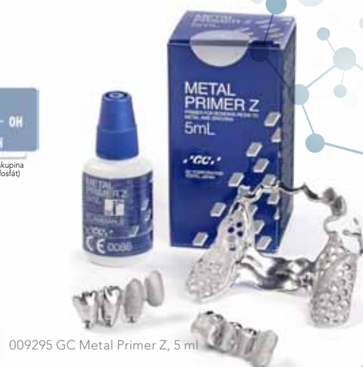
009295 GC Metal Primer Z, 5 ml

Kdykoli budete pracovat s kovovými konstrukcemi a materiály na bázi pryskyřice, zvolte tento nadčasový a jedinečný materiál.