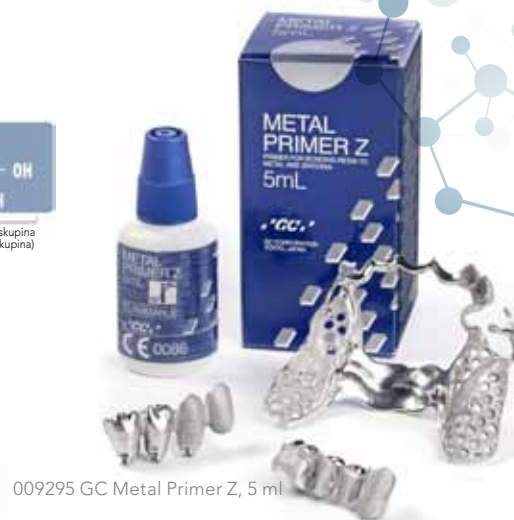
009295 GC Metal Primer Z, 5 ml

Uvijek kada radite s metalnim osnovama i akrilatnim materijalima, odaberite ovog univerzalnog heroja svih vremena.