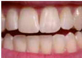
Säännöllisen Tooth Mousen käytön jälkeen