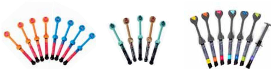
Gradia Direct Anterior / Posterior / X