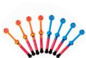
Gradia Direct Anterior / Posterior / X