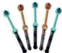
G-aenial Anterior / Posterior