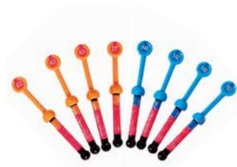
Gradia Direct Anterior / Posterior / X