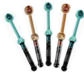
G-aenial Anterior / Posterior