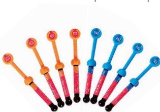
Gradia Direct Anterior / Posterior / X