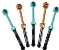
G-aenial Anterior / Posterior