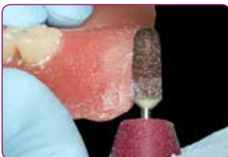
Parempi trimmattavuus, paremmin viimeistellyt reunat.

Materiaalia voi lisätä kolme kuukautta ensimmäisestä levityksestä ja näin mukautua limakalvolla ja luustossa tapahtuneisiin muutoksiin. Uuden Reline II remover for resin -irrotusaineen avulla pohjaus on helppo poistaa ja korvata nopeasti.