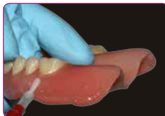
Reunojen suojaaminen Reline II finishing material -tuotteella.