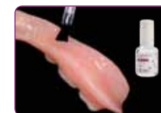
Naneti GC RELINE II Primer na područje za podlaganje. Blago osušiti vazduhom.