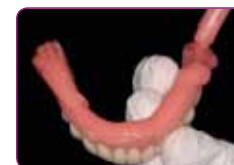
Naneti GC RELINE II (Extra) Soft. Vreme rada iznosi 2 minuta.