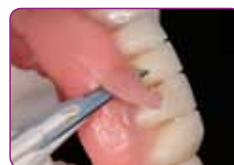
Višak materijala odstraniti skalpelom ili makazama. Obraditi gumicom GC RELINE II POINT FOR TRIMMING.