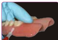
Zaštita rubova materijalom za završnu obradu Reline II