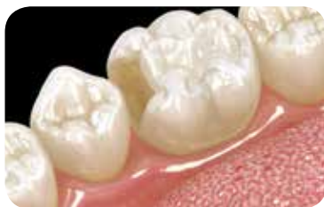
Έμμεσες αποκαταστάσεις από ολοκεραμικά, ζirkονία, αλουμινία ή υβριδικά κεραμικά (π.χ. CERASMART)