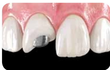
Indirektni radovi s metalnom osnovom (iz plemenitog i neplemenitog metala)

Komplet svih proizvoda i uputa potrebnih za sve rutinske oralne popravke na jednostavan i pametan način.