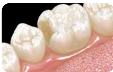
Indirektni radovi izrađeni iz staklokeramike, cirkonij-oksidge i aluminij-oksidge keramike ili hibridne keramike (npr. CERASMART).