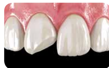
Kompositrestaurationer (direkta och indirekta)

Vilka är fördelarna? Tre produkter för alla reparationer!