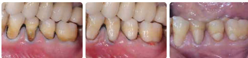
EQUIA Forte (EQUIA Forte HT priekšgājējs) restaurācijas pirms ārstēšanas (kreisajā pusē), sākuma stāvoklī (vidū) un pēc 6,5 gadiem (labajā pusē).