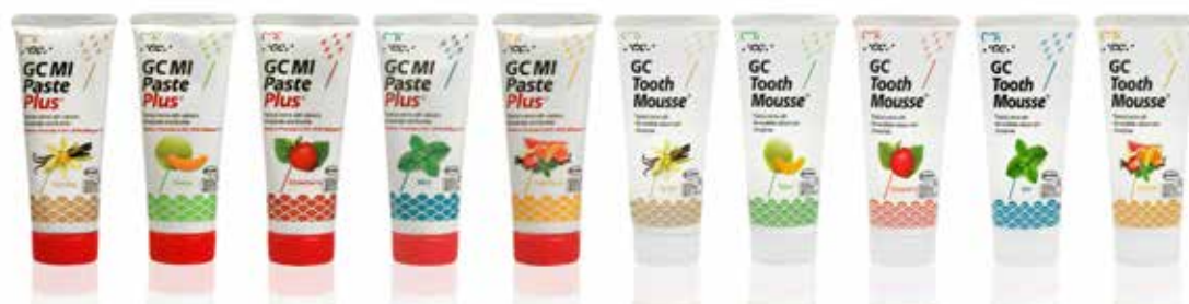
GC MI Paste Plus ar piecām izcilām garšām (kreisajā pusē) un tā fluorīdus nesaturošā alternatīva GC Tooth Mousse (labajā pusē).

Pacientiem ar samazinātu siekalu plūsmu ir tendence dot priekšroku vaniļas garšai.