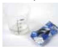
4. Syljen virtausnopeus