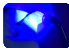
Kietinimas šviesa ekstraaliai

TEMPSMART DC gali būti kietinama šviesa, kuri pasižymi šiais privalumais: Jūs galite kontroliuoti kietinimo eigą bei optimizuoti galutinę medžiagos polimerizaciją. Taip procedūros tampa paprastesnėmis, daug efektyvesnėmis ir sutaupoma labai nemažai laiko. Kietinimas šviesa taip pat gerina laikinos restauracijos fizikines savybes, iš dalies tvirtumą.