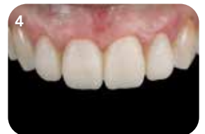
Met dank aan Dr. J. Tapia Guadix, Spanje