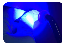
Полімеризація світлом екстраорально

TEMPSMART DC можна полімеризувати світлом , що дає великі переваги: ви можете контролювати момент твердіння та оптимізувати кінцеву полімеризацію. Це дозволяє зробити процедуру легшою та ефективнішою , що може заощадити вам багато часу . Світлове затвердіння також покращує фізичні властивості тимчасової реставрації, зокрема міцність на злам.