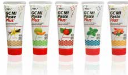
Pieejamas 5 garšas: vaniļas, melones, zemeņu, piparmētru un Tutti-Frutti