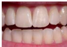
След редовна употреба на Tooth Mousse