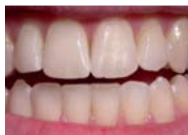
Nakon redovne upotrebe Tooth Mousse