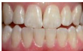
Dekalcifikacija nakon ortodontske terapije

Bijele mrlje znak su ranog karijesa - demineralizovanih područja zuba uzrokovanih kiselinom koju su stvorile bakterije plaka. To se uglavnom događa u području uz bravice, gdje se plak lako zadržava.