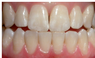
Ortodontiai kezelés utáni decalcifikáció

A fehér foltok a kezdődő fogszuvasodás jelei - olyan területek, ahol a lepedékben található baktériumok által termelt sav miatt az ásványi anyagok elvesznek a fogból. Ez többnyire a brackettek melletti területeken alakul ki, ahol a lepedék könnyen megtapad.