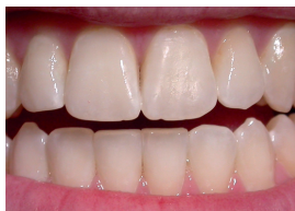
A Tooth Mousse rendszeres alkalmazása után