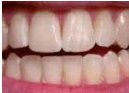
Na regelmatig gebruik Tooth Mousse