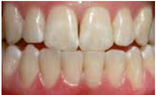
Ontkalking na orthodontische behandeling

Witte vlekken zijn een teken van beginnend tandbederf en vindt plaats op plekken waar mineralen in de tand worden opgelost door het zuur dat bacteriën in plak produceren. Dit gebeurt hoofdzakelijk naast de brackets waar plak zich gemakkelijk ontwikkelt en waar poetsen met een tandenborstel lastig is.