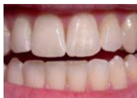
Po pravidelnom používaní Tooth Mousse