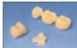
Esteettisiä proteettisia töitä

Jotta voidaan toteuttaa proteettisilta töiltä vaadittavaa esteettisyyttä, molempia GC UNIFAST -versioita on saatavissa useina eri väreinä. Hyvä värin istuvuus sekä pitävyyttä täyttää kaikki hampaanvärisille väliaikaistöille asetetut vaatimukset.