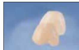
Ongelmaton väliaikaistyön poistaminen