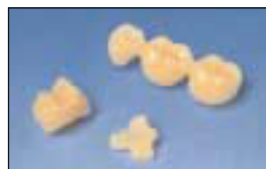
Estetisk protetisk restauration

För att uppfylla de estetiska behoven för en protetisk restauration, finns det ett urval av färger för båda versionerna av GC UNIFAST . Bra färganpassning och färgstabilitet uppfyller behoven för en tandfärgad temporär restauration.