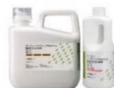
ハイジーンウォッシュ (酵素系洗浄剤)