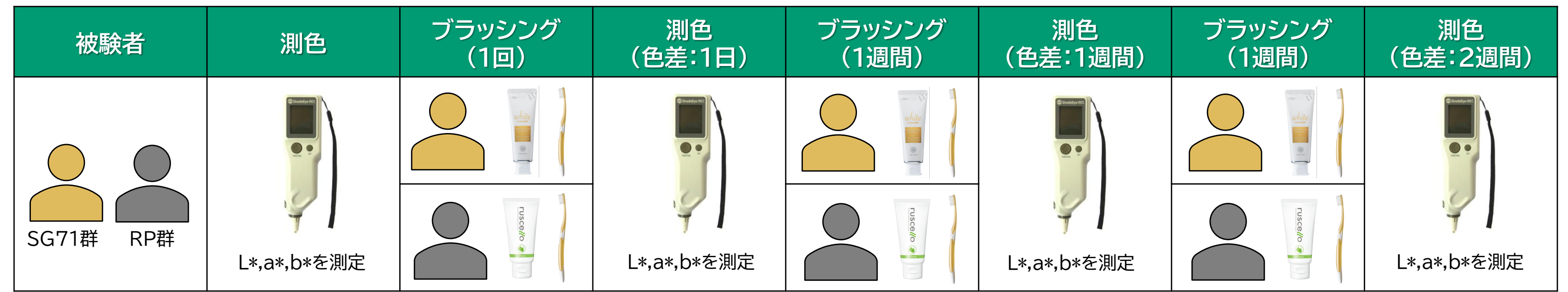
Figure 1. ルシェロ歯みがきペーストホワイトプレミアムケアおよびルシェロペーストにおける臨床試験プロトコル