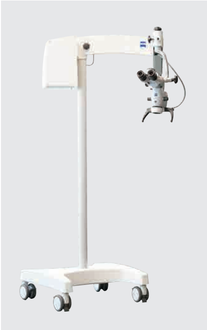
手術顕微鏡 OPMI® pico MORA (S 100 フロアスタンド)