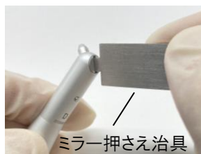
ミラー押さえ治具

付属のミラー押さえ治具を使用してミラー押さえを回し、ミラーを取り外します。ニードルチップアタッチメントの場合、ニードルチップを取り外します。