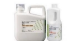
ハイジーンウォッシュ (酵素系洗浄剤)