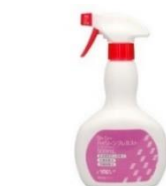
ハイジーンプレミスト