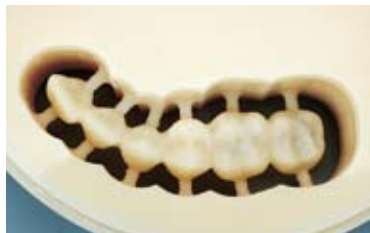
Aadva ミル LD-Iでの削り出し状態。