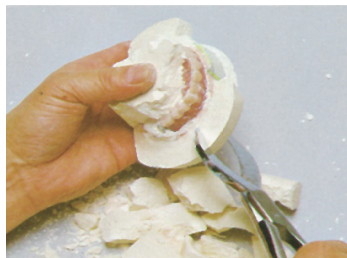
⑥掘り出し：強度のおちたアドバストーンは容易に壊れるため、床を傷つけずに掘り出せます。その後、仕上工程に入ります。