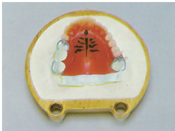
①下蓋埋没：ロウ義歯が完成したら、作業模型を下蓋フラスコにアドバストーンで埋没。

色調 1色 = ライトイエロー 包装 1缶 = 18kg シンプルパック1函 = 3kg