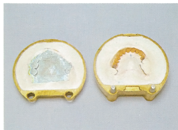
③流口ウ：アドバストーンの硬化を待ち、通法により流口ウ。その後、分割したフラスコの石こう面に分離材を塗布し乾燥ます。