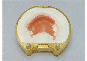
④レジン填入：餅状化させた床用レジン填入して試圧をします。アドバストーンはプレス圧に充分耐え割れたりしません。