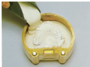
②上蓋埋没：分離材を塗り、床と人工歯部分にアドバストーンをていねいに盛った後、ひきつづき全体を埋没します。