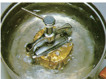
⑤重合：乾熱法、または湿熱法で重合。この間にアドバストーンの強度は急激に降下します。