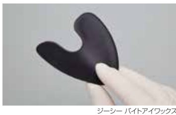
ジーシー バイトアイワックス

歯列にあわせた形状と、顎の大きさから選べる2サイズで、手軽に咬合接触状態を得ることができます。 ※湯煎して使用する場合は、約40℃のお湯に10~30秒つけて、口腔内で30秒程度保持します。